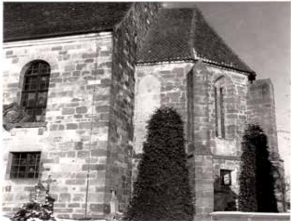
zugemauerte Chorfenster vor der Wiederherstellung im Jahr 1969

Die Südseite der Kirche bekam neue Türen und Fenster. Innen wurden schon die Treppen zur Orgelempore erneuert.