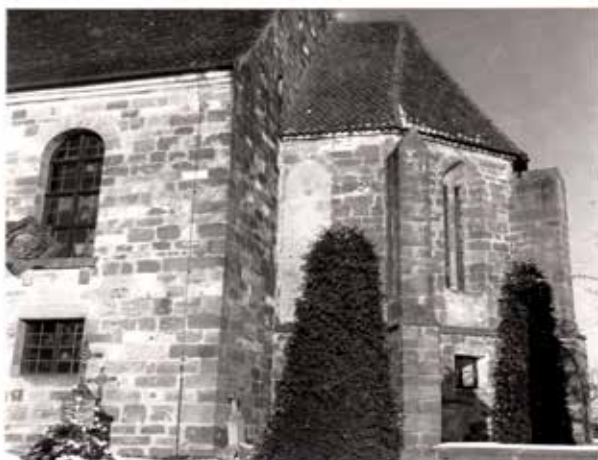
zugemauerte Chorfenster vor der Wiederherstellung im Jahr 1969

Die Südseite der Kirche bekam neue Türen und Fenster. Innen wurden schon die Treppen zur Orgelempore erneuert.